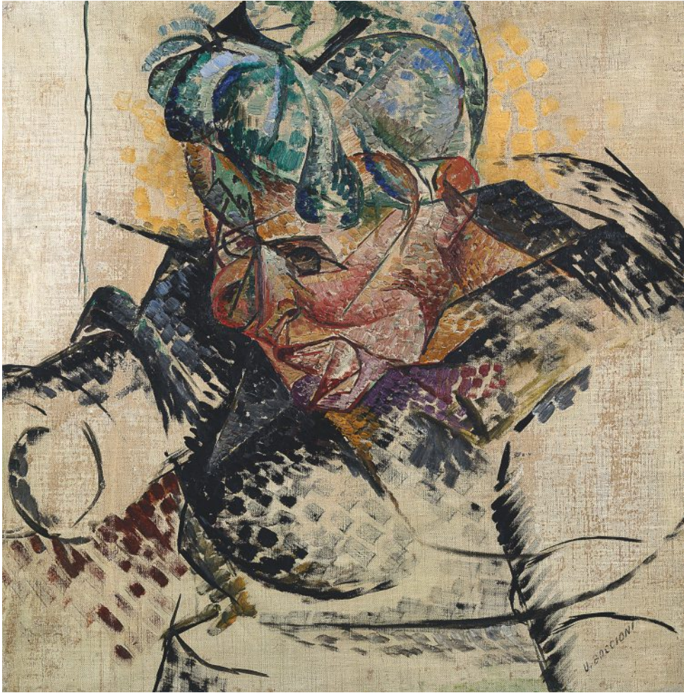
Studio di testa (La madre; Dimensioni astratte) Study of a Head (The Mother; Abstract dimensions) 1912 olio e tempera su tela oil and tempera on canvas Milano, Museo del Novecento

La figura del padre della pittura e della scultura futurista viene ripensata alla luce delle ricerche più recenti condotte sulla base di preziosi e quasi sconosciuti materiali d'archivio. L'esposizione si basa, infatti, sul rinvenimento di una serie di scritti e documenti inediti riferiti all'artista, riscoperti di recente presso la Biblioteca Civica di Verona, e sull'eccezionale corpus dei disegni boccioniani del Castello Sforzesco, esposti tutti insieme soltanto una volta, quarant'anni fa. Questi materiali sono integrati da preziosi documenti provenienti dai fondi archivistici dell'Archivio del '900 del Mart e da dipinti e opere fondamentali nella produzione dell'artista.