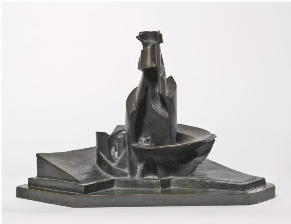
Sviluppo di una bottiglia nello spazio Development of a Bottle in Space 1912 bronzo (fusione del 1935) bronze (cast in 1935) Milano, Museo del Novecento

La mostra Umberto Boccioni. Genio e memoria rappresenta un'occasione imperdibile, tanto per gli studiosi quanto per il grande pubblico, per approfondire la conoscenza di uno tra i maggiori artisti del Novecento, il cui lavoro, riconosciuto in tutto il mondo, ha innovato radicalmente il panorama dell'arte internazionale.