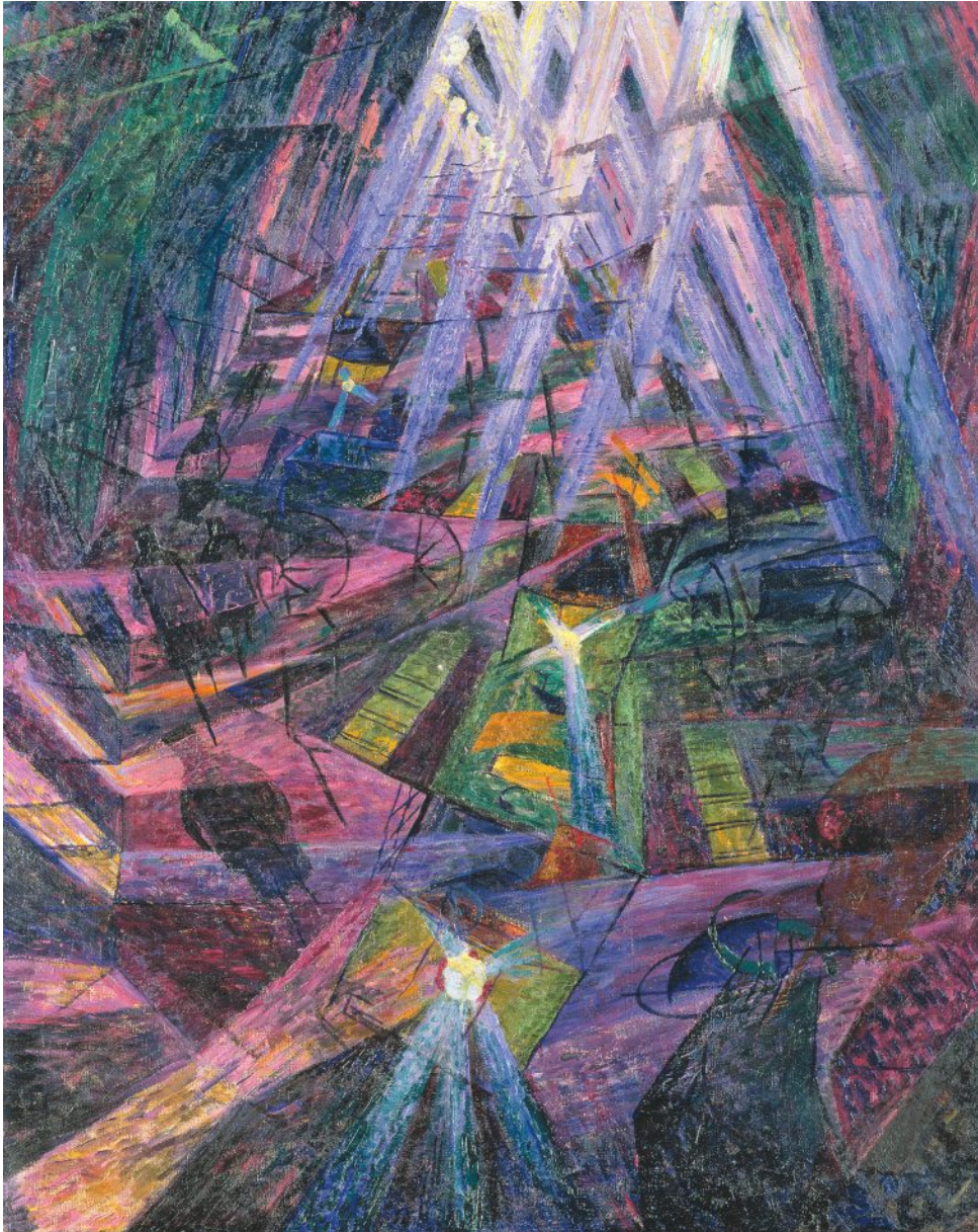
Forze di una strada Forces of a Street 1911 olio su tela oil on canvas Osaka City Museum of Modern Art

Questi nuclei tematici sono rappresentati da alcuni tra i maggiori capolavori dell'artista come, per esempio, il Nudo di spalle (Controluce) , appartenente alle collezioni del Mart, ma anche Tre donne , proveniente dalle Gallerie d'Italia-Piazza Scala a Milano, Forze di una strada del City Museum of Art di Osaka, Costruzione spiraleica del Museo del Novecento di Milano e la celeberrima scultura, icona della plastica futurista e riprodotta sulle monete italiane da 20 centesimi di euro, Forme uniche della continuità nello spazio , proveniente dall'Israel Museum di Gerusalemme.