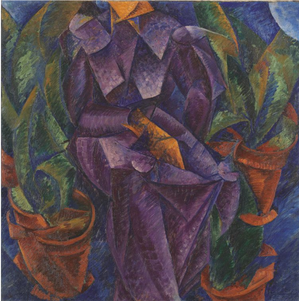
Costruzione spiraleca Spiral Construction 1913 olio su tela oil on canvas Milano, Museo del Novecento

Il percorso della mostra si dipana tra oltre 150 opere: disegni, dipinti, sculture, incisioni, fotografie d'epoca, libri, riviste e documenti raccontano la purtroppo breve vita dell'artista.